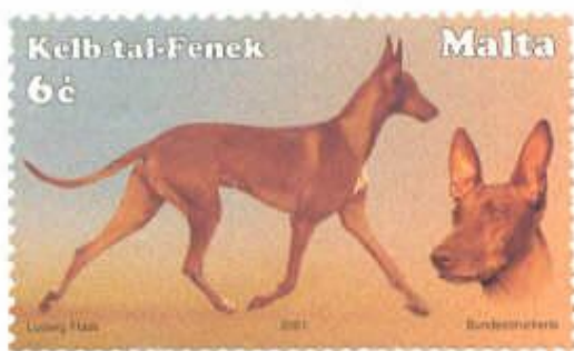
Maltesiskt frimärke, tryckt 2001

Men de vindhundslänkande hundar som finns avbildade i det forntida Egypten kallas Tesem, enligt en översättning från den hieroglyfiska benämningen. Det är en mycket vanlig avbildning av hund under den här historiska perioden. Huvudet på dessa Tesem hundar påminner en del om huvudet på farao-hunden, men det finns absolut inga konkreta bevis på att de på något sätt skulle vara besläktade. En populär teori om hur farao-hunden skulle ha kommit till Malta är att fenicierna tog med sig dessa jakthundar från Egypten. Inte heller för detta finns det några som helst historiska belägg. Nyligen DNA undersökningar tyder dessutom på att farao-hunden inte har några direkt prehistoriska rötter, utan istället har utvecklats på Malta i någorlunda modern tid.