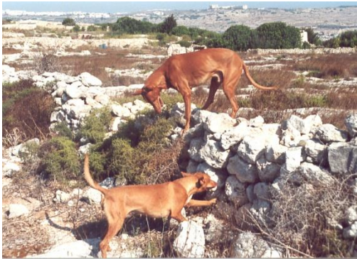
Jagande kelb tal-Fenek, bildkälla Wikipedia

ned bland de oländiga klippblocken. Illern, som även är försedd med ett litet halsband med en pingla på, släpps då ned i håligheten för att jaga ut kaninen. På andra sidan väntar hunden, alternativt jägaren med sitt stora nät. Det är här rasens förmåga att snabbt skifta mellan synintryck, hörsel eller doftspår verkligen kommer till användning. Samt dess uthållighet och envishet.