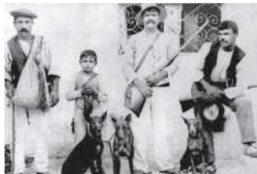
Maltesiska jägare med Kejb tal-Fenek

eller hund som jagar kanin. Enligt tradition har farao-hunden använts för just kaninjakt, där den uthålligt och självständigt jagar över stening och oländig terräng. Tappar farao-hunden bort kaninen går den istället snabbt över från syn till hörsel och lukt. Det är just den här egenskapen som gör farao-hunden extra svår för oss i vårt moderna samhälle att ha lös i skog och mark. När en vanlig vindhund avslutar sin jakt när den tappar sitt byte ur synhåll, övergår nämligen farao-hunden då istället till att spåra det.