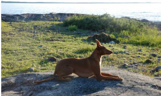
Ch Faouziah's Djoser

enklaste. Först och främst har faraohunden ett stort rörelsebehov. Tyvärr är den svår att ha lös, då jaktinstinkten är stark. Det blir långa dagliga promenader med hunden plus gärna springa lös i rashage eller på tomten istället. Om faraohunden inte får sitt motionsbehov tillgodosett kommer den att bli jobbig. Detta är en intelligent ras som lätt lägger ihop ett och ett. Har den tråkigt ensam hemma blir den gärna lite av en forskare och plockar kanske isär en och annan pryl för att kontrollera hur de sitter ihop eller om det eventuellt kan vara något kul.