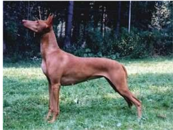
Ch Siphra's Tell Me No Lies

därefter även kontroll av titerhalt. Det tog tid och var kostsamt med många vaccinationer, blodprover, införseltillstånd och en massa papperarbete. Min Vera föddes 1998, i stamtavlan döpt till Siphra's Tell Me No Lies, men på grund av dåtidens införselregler kom hon till Sverige i början på 1999.